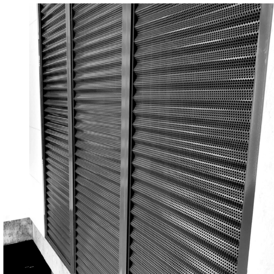
Panel Ondulado Vertical

Fabricación con medidas especiales sobre pedido