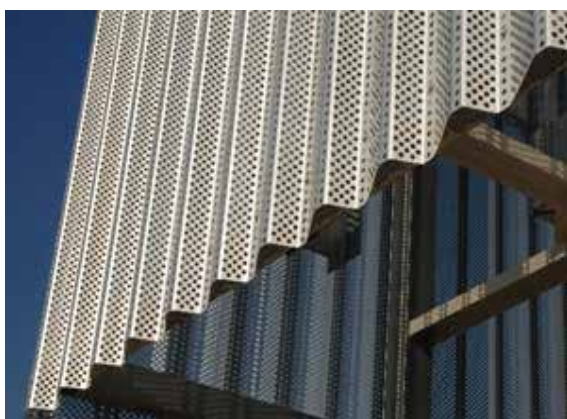
Panel Ondulado Horizontal